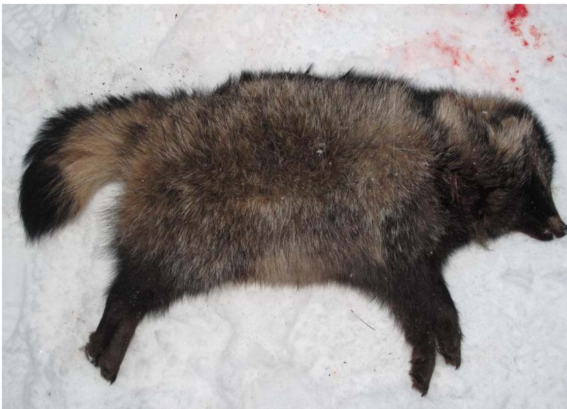
Mårhund skudt nær Bording december 2009