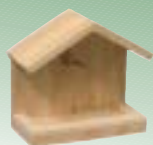
971067 Foderhus til væg til mejse- bolde og æbler