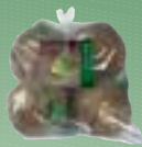
970169 Mejsbolde Kæmpe 4 stk./ps.