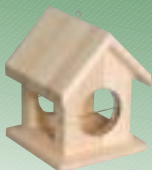
971098 Foderhus til mejsbolde og æbler 4-kantet