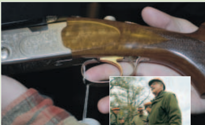
Skæftelængde tilpasses hos bøssehandleren.